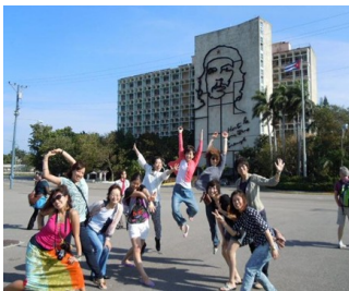
Congressistas Japoneses no Congresso de Cuba 2013